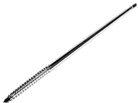
Imagem do Pino de Schanz Estéril fora da embalagem