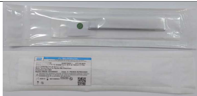
Duplo Sterile Bag