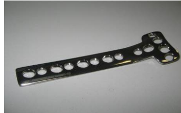
Placa T PFI