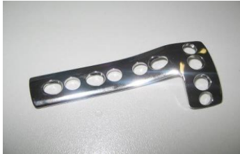
Placa L PFI

As ilustrações abaixo mostram os produtos que fazem parte do Sistema PFI Especial – IOL: