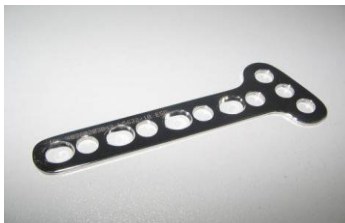
Placa T Ângulo Obliquo PFI