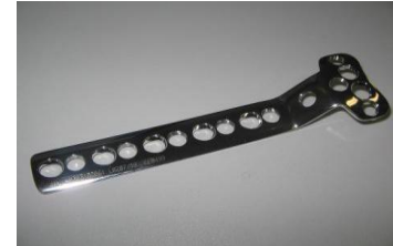
Placa T Dupla Angulação PFI