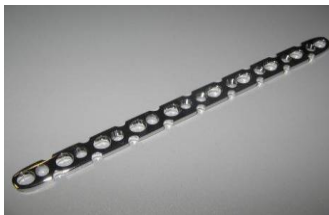
Placa Retá Reconstrução PFI