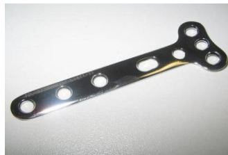
Placa T Ângulo Reto 3 + PFI