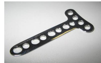
Placa T Ângulo Reto 4 + PFI