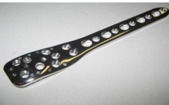
Parafuso Philos PFI