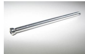
Parafuso Cortical PFI