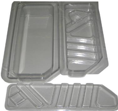
Duplo Blister de PET - Interna