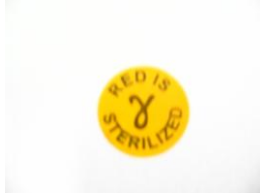
Selo Indicativo de Esterilização